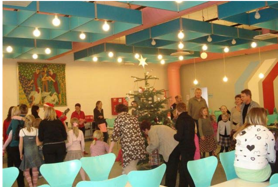
Dansen går om juletræet. Lørdag d. 24. november 2007.

Næste julekomsammen skal gerne have lidt større opbakning.