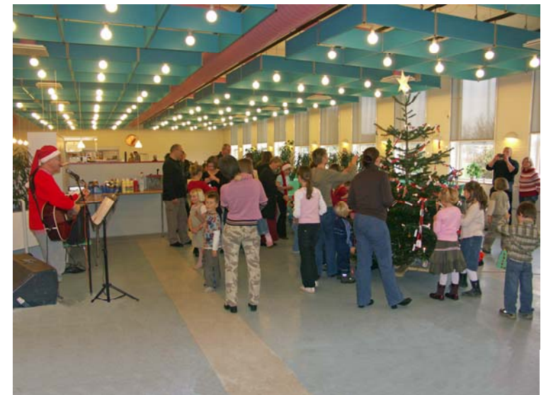
Foto fra Julekomsammen 2005